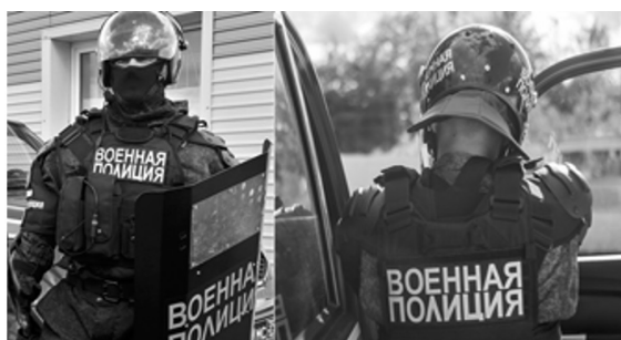
Рис. 2. Жилет пулестойкий «Модуль-Монолит-М»