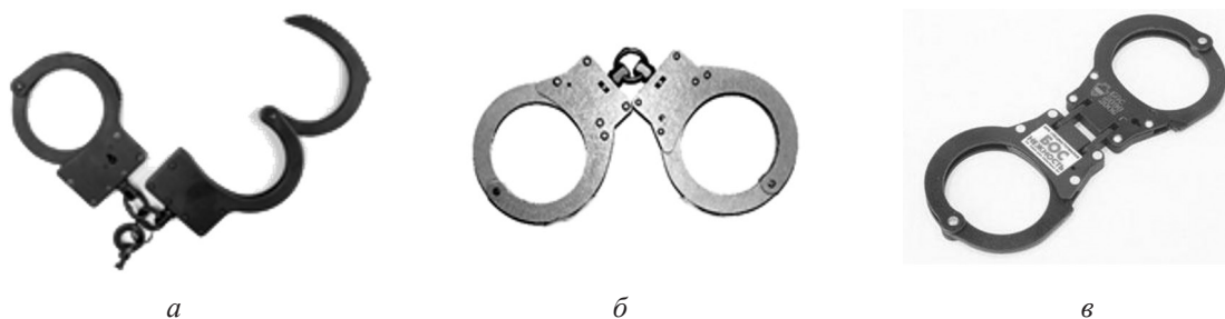
Рис. 8. Наручники: а — БР-С; б — БКС-1; в — БОС

Специальные средства постоянно совершенствуются, появляются их новые разновидности, улучшаются их характеристики. Военная полиция с учетом десятилетнего опыта применения