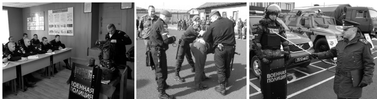
Рис. 1. Подготовка военнослужащих в учебном центре военной полиции ВС РФ

Основным предназначением специальных средств для военнослужащих военной полиции является отражение нападения на военнослужащих, лиц гражданского персонала, защита военных городков, воинских эшелонов и колонн, а также мест компактного проживания военнослужащих.