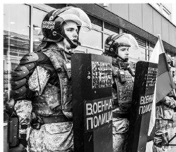
Рис. 3. Шлем защитный «Колпак-К 1сб»