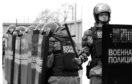
Рис. 4. Щит противоударный «Авангард-М»