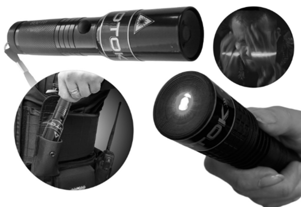
Рис. 9. Фонарь специальный лазерный «Поток»