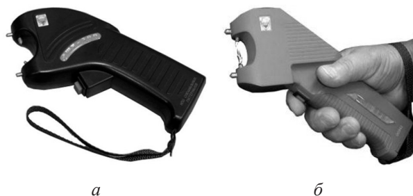
Рис. 7. Электрошоковые устройства: а — «ЭШУ-200»; б — «ЭШУ-300»