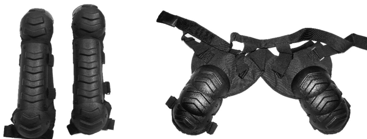
Рис. 5. Комплект средств противоударной защиты КЗС «Партнер»

На вооружении органов военной полиции находятся наручники оперативные и конвой-